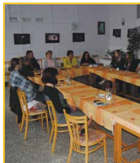
Konference, kterou Káčko připravilo, se zúčastnilo hned sedm organizací.

Káčko letos také poprvé postavilo svůj stá-