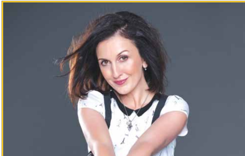
Radka Fišarová je dáma českého šansonu i muzikálu a hrdá patronka Pontisu.

Benefiční večer Pontisu s Radkou Fišarovou bude vyvrcholením oslav 20. výročí od založení společnosti. Uskuteční se ve čtvrtek 24. října ve velkém sále Domu kultury Šumperk. Bližší informace najdete postupně na stránkách www.pontis.cz .