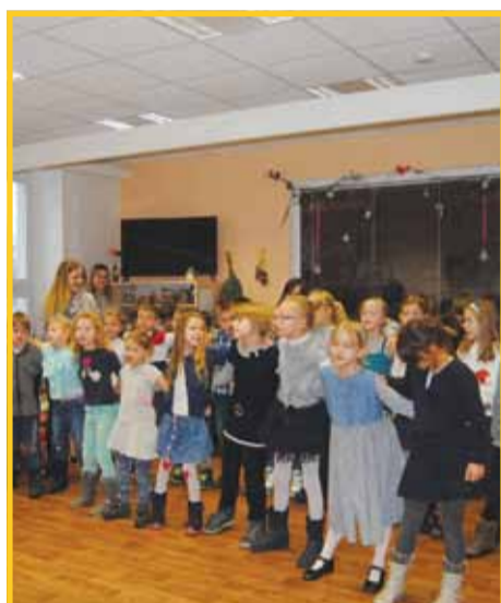
Seniory v odlehčovací službě navštěvují děti a učitelky z bludovské základní školy.