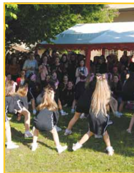
První zahradní Festival rodiny se vydařil.