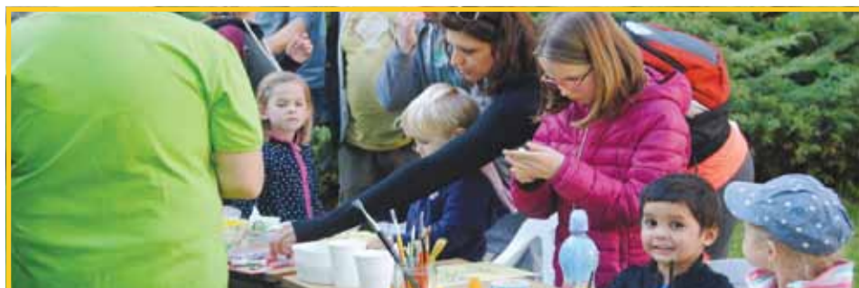
O zábavné dílničky byl na Festivalu rodiny velký zájem.

Letošnímu Šumperskému Majálesu patří také díky za malou dražbu, kterou uspořádal ve prospěch Nízkoprahového klubu Rachot. Peníze přispějí na další vybavení klubu.